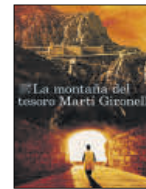
La montaña del tesoro