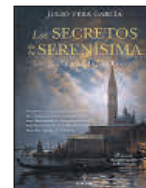
Los secretos de la Serenisima

Tiburón , Parque Jurásico , las conmovedoras narraciones de La lista de Schindler , Salvar al soldado Ryan , E.T. , el extraterrestre , Encuentros en la tercera fase , El color púrpura y Minority Report . El cine de Steven Spielberg está unido a nuestra memoria desde la infancia. El periodista cinematográfico Ian Nathan recorre la descomunal trayectoria del realizador, destaca sus cualidades artísticas y nos revela las múltiples capas de su filmografía. El autor nos acerca a sus fuentes de inspiración, sus interpretaciones, matices y las temáticas recurrentes de su filmografía. Se edita el 13 de noviembre.