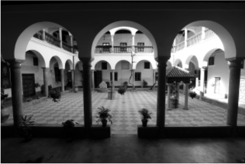
Claustro del convento de las Jerónimas de San Pablo

La madre Teresa tiene otra versión de los hechos sobre la desaparición de la reliquia. Una interpretación que contradice la oficial, la registrada en la prensa. Le llegó de boca de dos de sus hermanas de sangre, que eran novicias cuando estalló la contienda civil de 1936 y que fueron testigos de lo sucedido. «Los soldados entraron en el convento y cuando sacaban detenidas a las monjas uno de ellos, en la portería, tenía en su mano la Espada de san Pablo. Algunas hermanas gritaron que la soltara, que era una reliquia, pero él se limitó a decir que era un arma para intentar matarles y que la iba a confiscar», relata. ¿A dónde fue a parar? ¿Se destruyó o se conservó escondida en algún sitio fuera del cenobio?