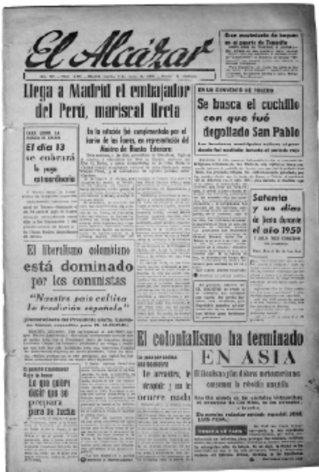
Portada del periódico El Alcázar del 3 enero 1950.

El 3 de enero de 1950 el diario El Alcázar titulaba en su portada: «Se busca el cuchillo con que fue degollado San Pablo». El antetítulo era más clarificador, si cabe: «En un convento de Toledo». La prensa no dudó en recoger tan inusual acontecimiento, haciendo una leve referencia a que el cuchillo lo trajo el cardenal Gil de Albornoz a Toledo, aparte de aclarar lo que ocurrió con la reliquia durante la Guerra Civil, en lo que es hasta la fecha una creencia fehacientemente aceptada de lo sucedido. Pero eso no quiere decir que sea la verdad.