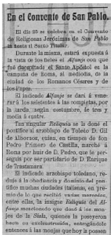
Recorte de El Eco Toledano . Diario defensor de los intereses morales y materiales de Toledo y su provincia . Año IV. Número 625. 24 de enero de 1913.

Da la impresión de que la obsesión de Franco por el cuchillo de san Pablo le persiguió durante años. Quienes se dedicaron a biografiar su figura no inciden sobre la fijación con otro talismán de manera tan persistente, a excepción de «la mano milagrosa de Santa Teresa», un relicario compuesto por un guante de plata con dedos engalanados por piedras preciosas que guarda en su interior los supuestos restos incorruptos de la santa. También destaca el hecho de que en su lecho de muerte le trajeran el manto de la Virgen del Pilar para colocarlo a los pies de su cama. Así como las interpretaciones herméticas de su vitor, que apareció de la nada para celebrar su victoria militar y desapareció casi de igual forma; o su animadversión a la masonería, a pesar de que dos de sus hermanos muy posiblemente lo eran; o la simbólica arquitectura de su faraónica tumba en el Valle de los Caídos. Son muchos los elementos que refuerzan la idea de que Franco, al igual