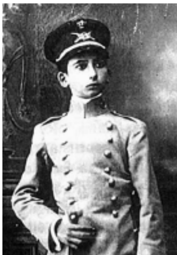
Francisco Franco como cadete de la Academia de Infantería de Toledo.

Iniciar la búsqueda en 1950 tenía una intención prioritaria, según se recoge en la prensa de la época, y era recuperar