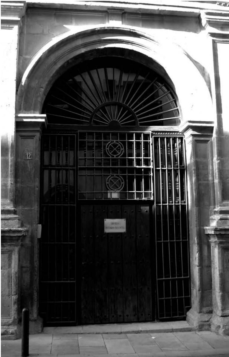
Puerta de acceso al Archivo Histórico Provincial