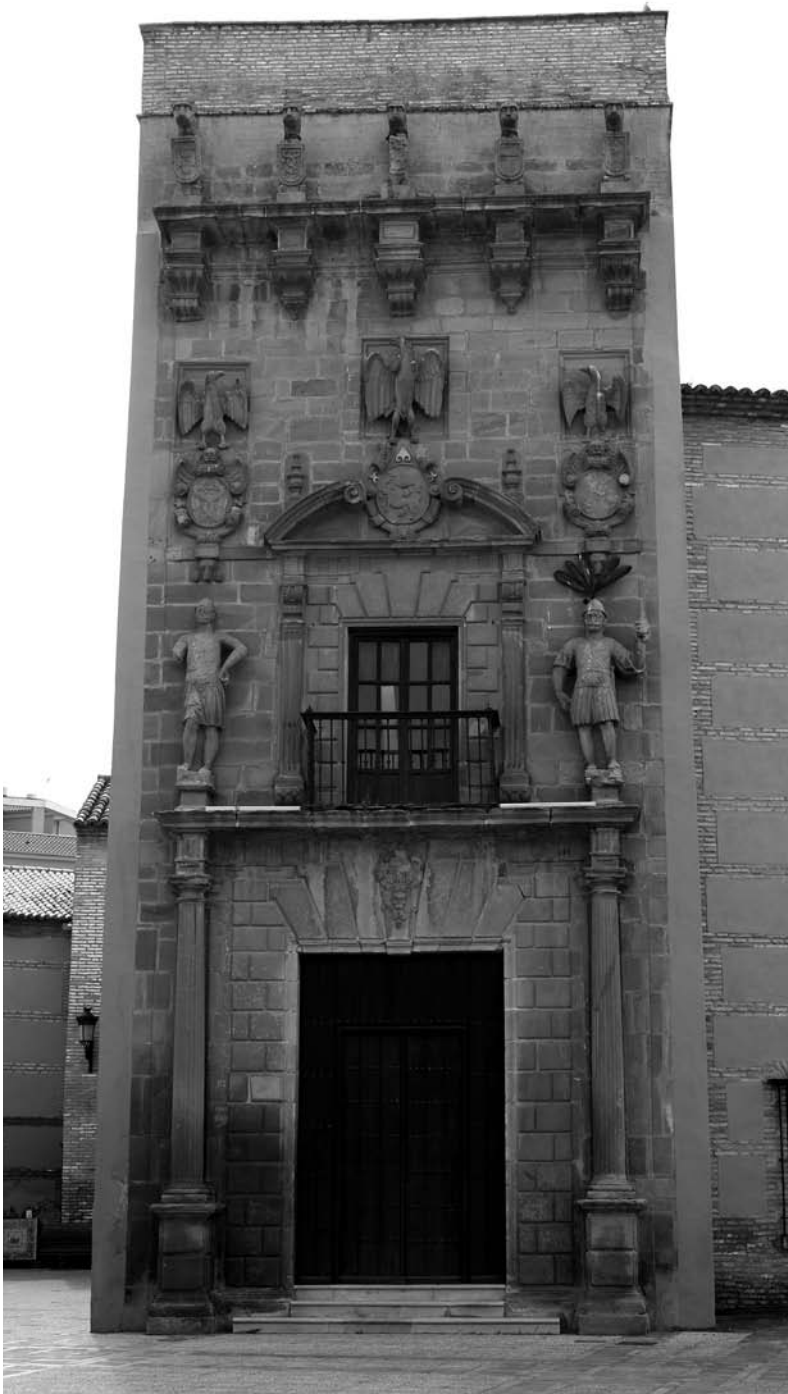
Puerta de entrada al Palacio Niños de Don Gome