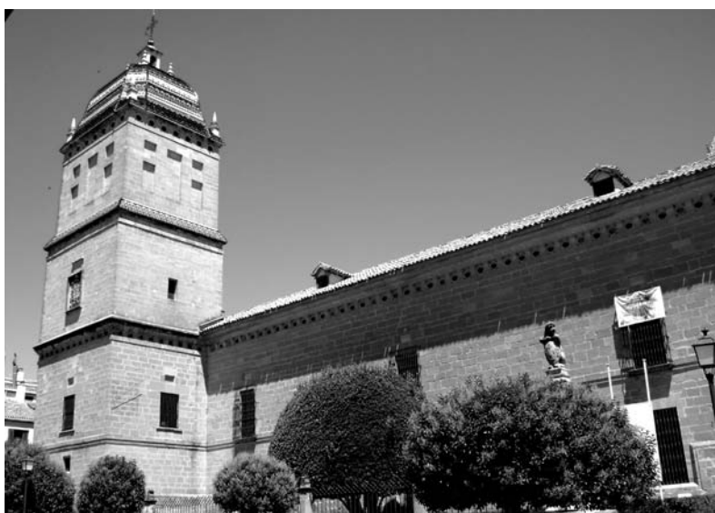
Fachada del Hospital de Santiago de Úbeda

Una vez restaurado el hospital y reutilizado como centro cultural surgieron nuevos acontecimientos insólitos. Ruidos inexplicables de pasos o voces desconocidas se escuchaban en el interior del edificio. Incluso alguno de los trabajadores aseguraba haber visto la silueta de una monja (vestida con cofia al estilo antiguo) deslizarse por las dependencias del edificio. Las azafatas de exposiciones contaban que en ocasiones tenían la sensación de que alguien las seguía (a lo que se sumaba el sonido de pasos a sus espaldas) cuando se encontraban solas en las salas del edificio. Las limpiadoras describían que parecía que alguien les susurrara o les soplara al oído cuando estaban trabajando allí... Los comentarios sembraron la inquietud entre los trabajadores del lugar. En algunos casos guardias de seguridad se mostraban reacios a trabajar solos.