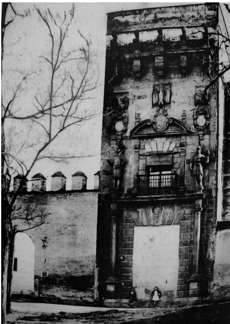
Puerta principal del Palacio tapiada, año 1910.

guardia inmortal, para que en el futuro nadie osara abrir la puerta principal del edificio, que, lejos de ser una vergüenza para su padre, se mostraba como testimonio del honor impertérito del que fuera el hombre más valeroso de la ciudad en aquel tiempo.