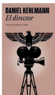
EL DIRECTOR Daniel Kehlmann Random House, traducción de Isabel García Adán, 376 pp., 22,90 €