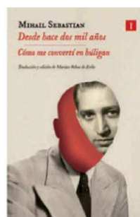
DESDE HACE DOS MIL AÑOS Mihail Sebastian Impedimenta, traducción de Marian Ochoa, 400 pp., 22,95 €

la literatura hispanoamericana actual y la primera de lo que sería la «Trilogía del agua» o «Trilogía de la emigración».