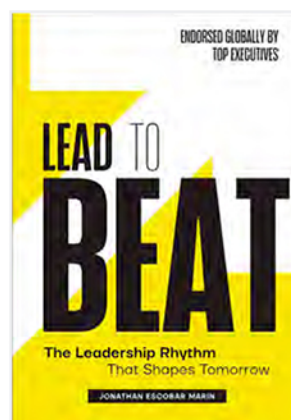
ISBN papel: 978-1639081486 Editorial: Fast Company Press Precio tapa dura: 32,60€

"Libro lleno de pragmatismo que todo leader que debería leer. Foco para hoy y para el futuro para transformarse y transformar a las organizaciones."