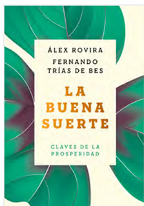
ISBN papel: 978-84-08-21603-2 Editorial: Planeta de libros Precio tapa dura: 16,95€

"Se trata de un libro metafórico y novelado, un cuento que habla de nuestra responsabilidad y cómo aquello que a veces achacamos al azar no es más que el resultado de nuestras decisiones."