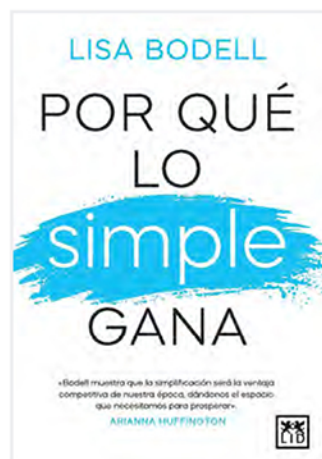
ISBN papel: 978-84-10221-51-2 Editorial: Lid Editorial Precio: 23.95€