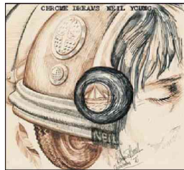
Neil Young Chrome dreams

WARNER / Chrome dreams , uno de los discos más personales y potentes de Neil Young , tenía prevista su publicación en 1977 pero quienes están familiarizados con la carrera del artista canadiense saben que es mejor dejar que los cambios siempre fueron habituales en su carrera. Este disco ha tenido un camino largo hasta esta versión final que se publicará el 11 de agosto, en edición digital, CD y doble vinilo. Un álbum que contiene algunas de las canciones más inolvidables del rock y que ahora se publica en la versión que Young había concebido, un repertorio con doce clásicos del músico que aparecen aquí en sus versiones originales grabadas entre 1974 y 1976.