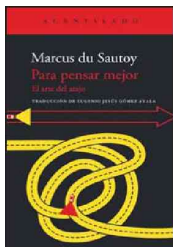
Marcus du Sautoy Para pensar mejor