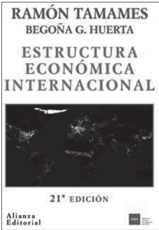
Figura 3. 21.ª y última edición, por ahora, del libro Estructura económica internacional , Alianza Editorial, Madrid, 2009, reimpreso en 2016. Los coautores tienen en perspectiva su reedición renovada (22.ª ed.), previsiblemente en 2023.

meros establecimientos americanos en Canadá, y más concretamente en Quebec. Pero esas colonias no dieron el fruto apetecido, y algo parecido sucedió con las factorías francesas en la India, que quedaron muy a la zaga de las que Holanda había montado más hacia el este, en las Indias Orientales