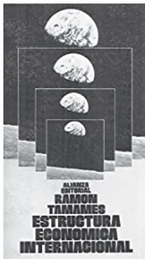
Figura 1. Primera edición de Estructura económica internacional , Alianza Editorial, Madrid, 1970. Fue el libro que dio una primera visión en España de los intercambios a escala mundial con todo su desarrollo institucional. Esta obra del autor ha tenido y sigue teniendo gran difusión en todos los países hispanohablantes.

nio de la plaza flamenca de Brujas (hoy en Bélgica) fue rotundo, por lo menos entre 1300 y 1450. Desde Brujas partían las líneas que enlazaban con las ferias comerciales de Castilla hacia el sur y con las ciudades hanseáticas del litoral de Alemania y de Escandinavia hacia el norte 3 .